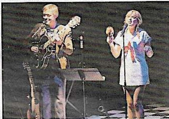
Quand Alambic théâtre ressuscite une page méconnue de l'histoire du music-hall.