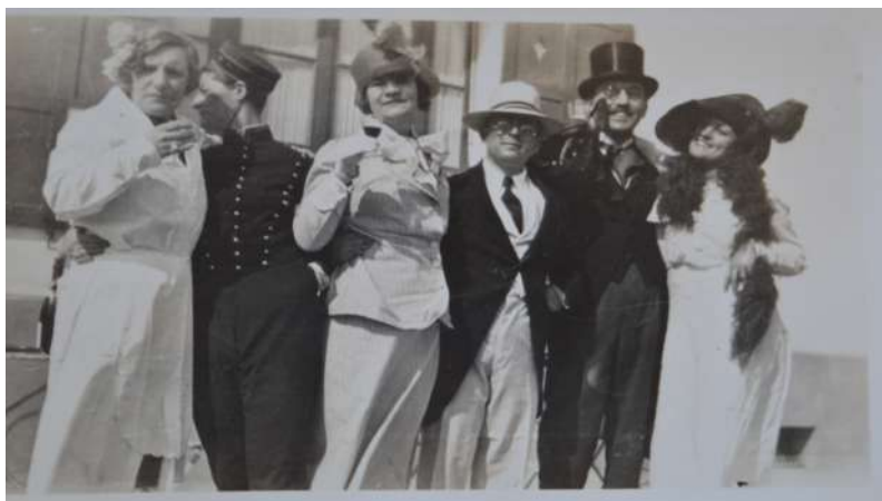
Fête costumée au R26, circa 1930.