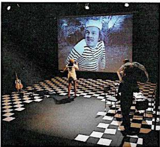
Philippe Katherine s'invite au R-26, et ça lui va bien.